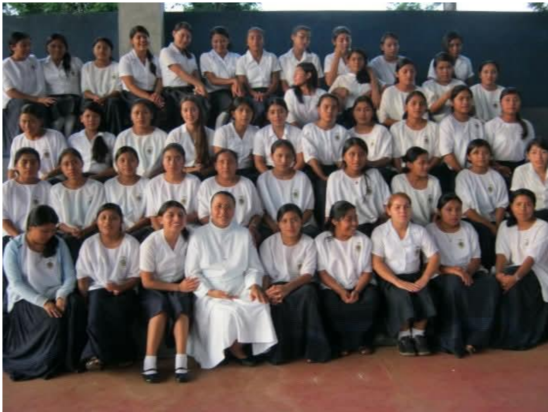
Alumnas de TERCERO BASICO en el C.P.F RATZ'UM KICHE

La ayuda ha sido coordinada por las Hermanas de la Caridad de Santa Ana del Centro de Promoción Femenina RATZ'UM KICHE, con las que colaboramos habitualmente, apoyando su labor educativa con las niñas y jóvenes de la zona.